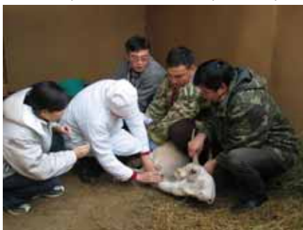
Взятие образца крови у выращенного в неволе самца сайгака.