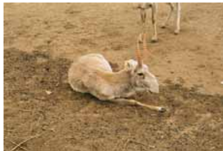
Самцы сайгака: а) Номинативный подвид S.t.tatarica в Центре диких животных РК. б) Монгольский сайгак.

Существует так же проблема генетических различий четырех популяций номинативного подвида. Поскольку численность Бетпакалинской популяции достигла критически низких величин, является ли жизненно необходимым срочное вмешательство для предотвращения потери генетического разнообразия в случае утраты этой популяции? Или необходимо ограничить фондирование, направив его на поддержание популяций, имеющих больший шанс на выживание, если Бетпакалинская популяция не является генетически отличной? Каковы последствия смешанного происхождения выращенных в неволе стад и межпопуляционного обмена? Проект, финансируемый INTAS, поставил перед собой задачу получить ответы на эти вопросы.